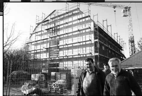
Az épülő új iskolaszárny

pályázaton negyven millió forintot nyert az önkormányzat a Kastélypark felújítására. Ebből a jövő év során járdák épülnek, kandeláberek kerülnek felállításra. Szerencsésen egybeesik a felújítás a már korábban nyertes, lapidárium építésére, víztorony rekonstrukciójára indított pályázat megvalósításával, így a Tenisz Club által benyújtott és szintén nyertes pályázattal, mely egy közösségi ház építését tűzte ki célul – további 7-8 millió forintos keret áll rendelkezésre a kastélyparki fejlesztésekre. Ez mellett már szinte „eltörpül”, de mégis örömteli, hogy a tavaszi belvízi védekezés költségeihez is nyert az önkormányzat a havária alapból három millió forintot. Jelentős eredményekkel zárhatja tehát Adony az idei évet, és szép fejlesztéseket hajthat végre a következő évben is, melyek között mindenképpen említésre érdemes az iskola új, hat tantermet befogadó szárnyának befejezése, átadása.