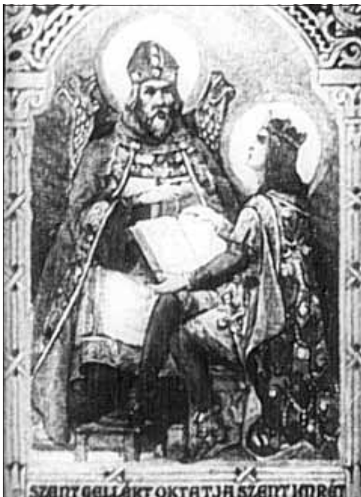
Szent Gellért és Szent Imre

Maga Szent László vezette Szent István tetemének ünnepélyes fölemelését (fölemelés, elevatio a szentté avatás része: a holttestet az eredeti sírból fölemelik, és díszes koporsóban új helyre temetik), amelynek során számos gyógyulás, csoda történt. Ezeket az előítéletektől mentes történetírás is rendkívüli eseményekként tartja számon. Valamivel később következett Csanádon Szent Gellért oltárra emelése, majd Szent Imréé ugyancsak Székesfehérvárott, s végül két szerzetes, a zabori remeték, András és Benedek szentté avatása.